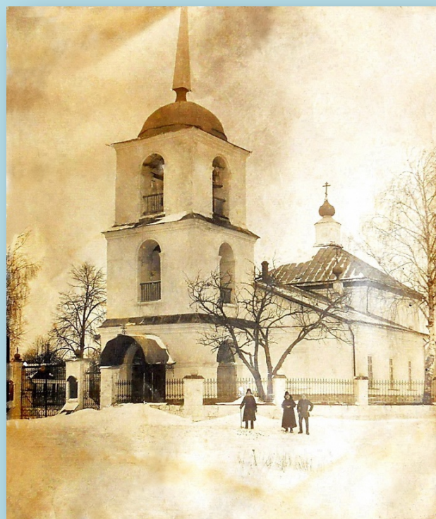
Петропавловский храм с. Маливо

1. Петропавловская церковь села Маливо построена в 1795 году старанием князя Петра Александровича Черкасского 1 .