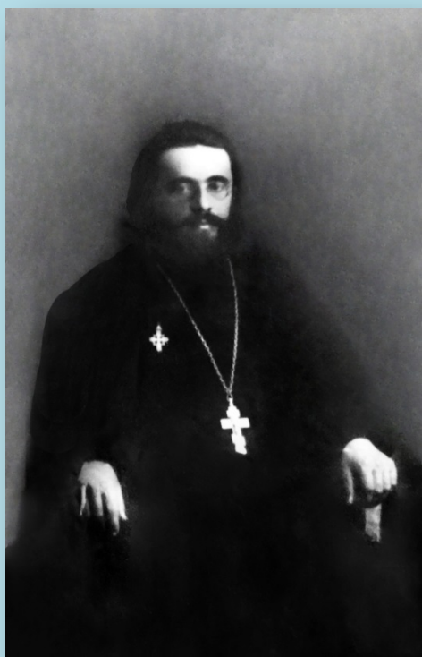
Священник Евгений Исадский