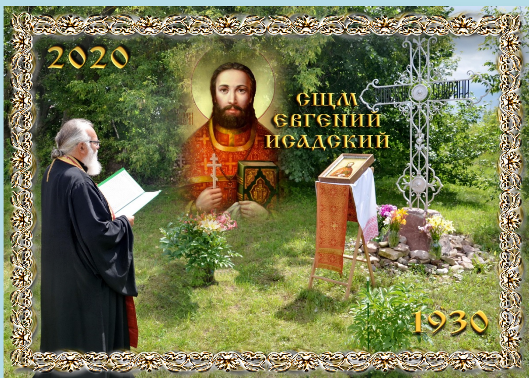
Молебен у креста